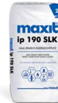
maxit ip 190 SLK Kalk-Zement-Faserleichtputz, schnell

Anwendungsbereich Für Mauerwerk aller Art, Beton und Putzträger, im Außen- und Innenbereich als leichter, spannungsarmer Unterputz auf allen gängigen Untergründen, speziell für moderne, wärmedämmende Mauerwerke mit \lambda > 0,14 \text{ W/mK} .