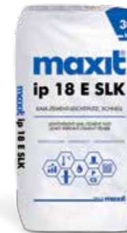
maxit ip 18 E SLK Kalk-Zement-Leichtputz, schnell

Produktkurzbeschreibung maxit ip 18 E SLK ist ein mineralischer Putz der Mörtelgruppe P II nach DIN 18550 und der Festigkeitsklasse CS II DIN EN 998-1 mit optimiertem Abbinde- und Kratzverhalten als ergiebiger, spannungsarmer Unterputz mit guten wärmedämmenden Eigenschaften, leichter Verarbeitung und gutem Standvermögen. Putzdicken 10 – 30 mm.