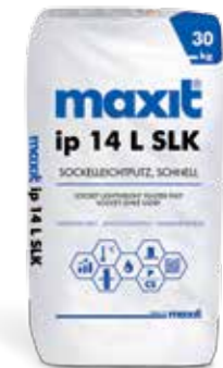
maxit ip 14 L SLK Sockelleichtputz, schnell

Anwendungsbereich Für Mauerwerk aller Art, Beton und Putzträger im Außen- und Innenbereich als leichter, extrem spannungsarmer Unterputz auf allen gängigen Untergründen, speziell für moderne, höchstwärmedämmende Mauerwerke mit \lambda > 0,065 \text{ W/mK} .