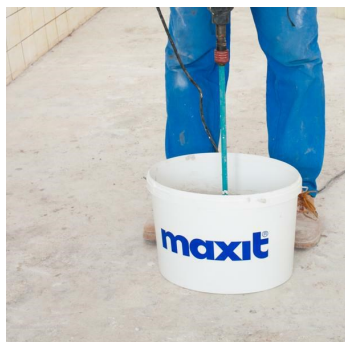
Obr.2 Namíchání lepidla míchadlem.