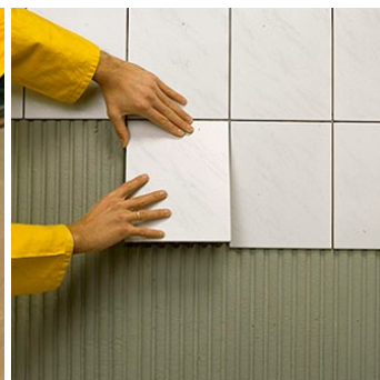
Obr.3 Lepení obkladů nebo dlažby.