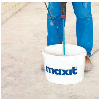
Obr.2 Namíchání lepidla míchadlem.