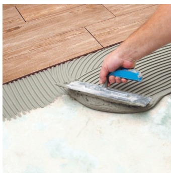
Obr.3 Nanášení lepidla na podklad.