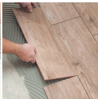
Obr.3 Lepení obkladů nebo dlažby.