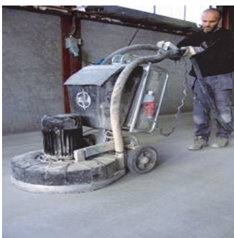
Obr.1 Podklad připravit předepsaným způsobem.