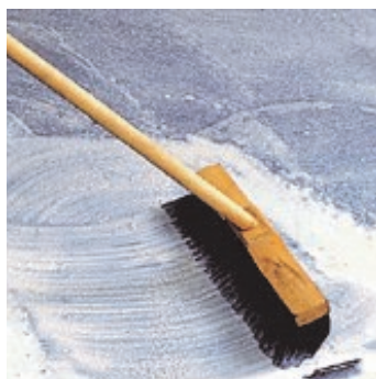
Obr.2 Podklad zpenetrovat předepsanou penetrací.