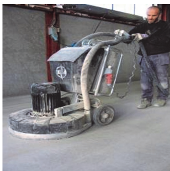
Obr.1 Podklad připravit předepsaným způsobem.