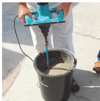
Obr.3 Namíchání materiálu pomocí míchadla nebo m-tec duo-mixu nebo za sila pomocí m-tec