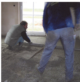
Obr.3 Urovnání materiálu stahovací latí a uhlazení.