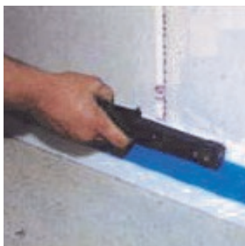
Obr.1 Osazení okrajových pásků.