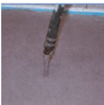
Obr.2 Doprava materiálu do místa použití pomocí SMP.