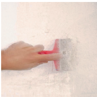
Obr.2 Odstranění nesoudržných vrstev.