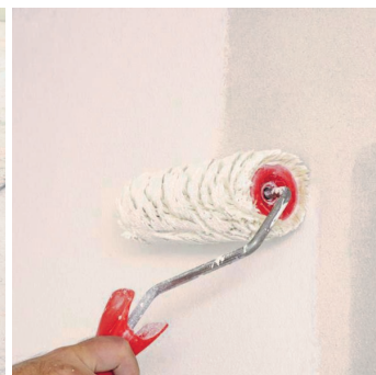
Obr.4 Provedení penetračního nátěru v 1 nebo 2 vrstvách.