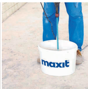
Obr.3 Promíchání penetračního nátěru.