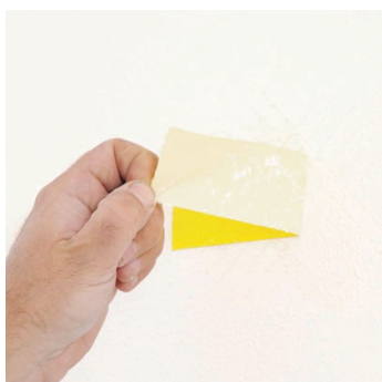
Obr.1 Příp. zkouška přídržnosti podkladních vrstev.