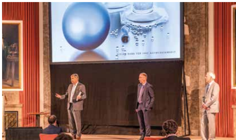
Die Nominierung zum Deutschen Zukunftspreis am 09.09.2020 im Ehrensaal des Deutschen Museums in München.