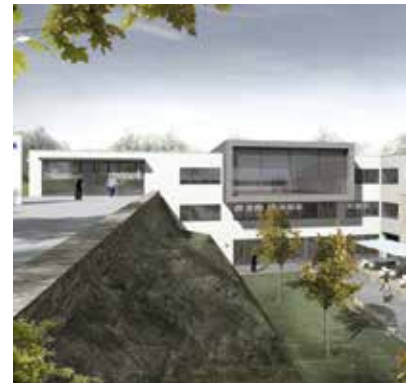
Das Forschungs- und Entwicklungszentrum in Azendorf