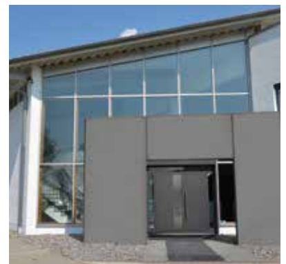
Das Schulungszentrum in Niederwinkling