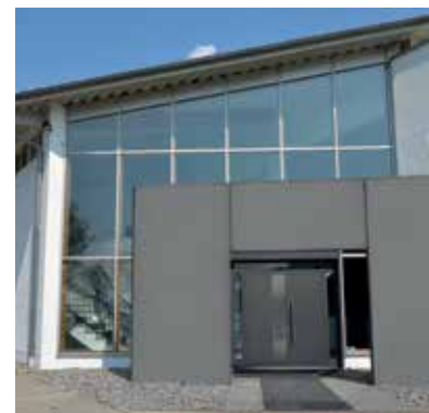
Das Schulungszentrum in Niederwinkling