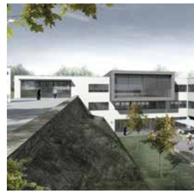
Das Forschungs- und Entwicklungszentrum in Azendorf

Selbstverständlich organisieren wir bei Bedarf auch einen Bustransfer für Ihre Anreise. Bitte sprechen Sie Ihren maxit Fachberater an.